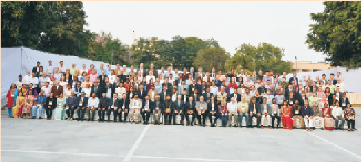
वाजा वार्षिक समारोह के प्रतिभागी

समापन समारोह के बाद 2 नवम्बर को प्रतिभागियों को राष्ट्रीय प्राणी उद्यान, नई दिल्ली घुमाया गया और उन्हें देश की जैविक विविधता से अवगत कराया गया। इसके बाद पुराने किले में शाम को उन्हें "प्रकाश एवं ध्वनि" कार्यक्रम दिखाया गया। अंत में CBSG तथा वाजा प्रतिभागियों ने होटल अशोक में रात्रि भोज ग्रहण किया। इसके बाद CBSG प्रतिभागियों को विदाई दी गई तथा वाजा प्रतिभागियों का आइस ब्रेकर स्वागत किया गया।