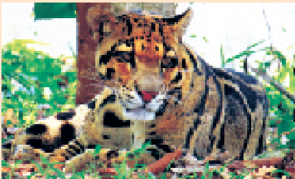
क्लाउडिड तेंदुआ (नियोफेलिस नेबूलोसा), सिपाहीजला प्राणी उद्यान, त्रिपुरा

केन्द्रीय चिड़ियाघर प्राधिकरण का लक्ष्य भारत में संरक्षिता में उचित प्रदर्शन हेतु एवं आगामी अत्यावश्यकताओं के लिए बीमा के रूप में कम से कम 100 अलग-अलग उचित रूप से जन्मे एवं आनुवांशिक रूप से, शारीरिक रूप से तथा व्यवहारिक रूप से स्वस्थ प्रत्येक लक्ष्यांकित प्रजातियों का है।