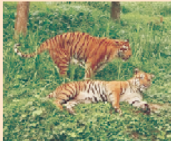
रॉयल बंगाल टाईगर (पेंथरा टिगरिस टिगरिस), सिपाहीजाला प्राणी उद्यान, त्रिपुरा

केन्द्रीय चिड़ियाघर प्राधिकरण के मुख्य उद्देश्य हैं-