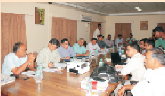
शेर पूछ बंदर हेतु समन्वय बैठक