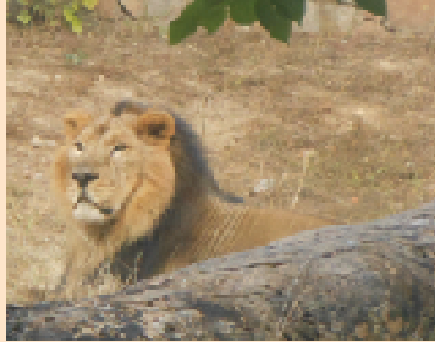
एशियाटिक लॉयन (पेंथरा लिओ परसिया), राष्ट्रीय प्राणी उद्यान, दिल्ली

केन्द्रीय चिड़ियाघर प्राधिकरण, पर्यावरण एवं वन मंत्रालय के अधीन एक संवैधानिक निकाय है जिसकी स्थापना भारत सरकार द्वारा वर्ष 1992 में वन्य जीव (संरक्षण) अधिनियम, 1972 में संशोधन (1991) के माध्यम से की गई थी। केन्द्रीय चिड़ियाघर प्राधिकरण की स्थापना और भारत में चिड़ियाघरों को मान्यता देने के लिए अधिनियम में एक पृथक अध्याय (अध्याय-IVक, धारा 38A से 38J) जोड़ा गया था। भारतीय वन्यजीव बोर्ड ने देश में चिड़ियाघरों की स्थापना एवं रख-रखाव के लिए विस्तृत अध्ययन करने के लिए 18 नवम्बर, 1972 को नई दिल्ली में आयोजित अपने नौवें सत्र में "चिड़ियाघर के संबंध में विशेषज्ञ समूह" के रूप में अपने चिड़ियाघर विंग का पुनर्गठन किया। चिड़ियाघर संबंधी विशेषज्ञ समूह ने जून, 1973 में अपनी रिपोर्ट प्रस्तुत की जिसे बोर्ड द्वारा नवम्बर, 1973 में स्वीकार कर दिया था। रिपोर्ट में एक केन्द्रीय एजेंसी (चिड़ियाघर अनुदान आयोग) स्थापित करने तथा इसे लागू की सिफारिश की गई थी, वन्य जीव (संरक्षण) अधिनियम, 1972 को संशोधित किया गया था और केन्द्रीय चिड़ियाघर प्राधिकरण की स्थापना की गई थी।