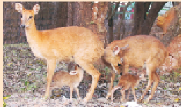
चौसिंगा (टेट्रासिरस क्वाड्रीकोरनिस), नंदनकानन जैविक उद्यान, ओडिशा