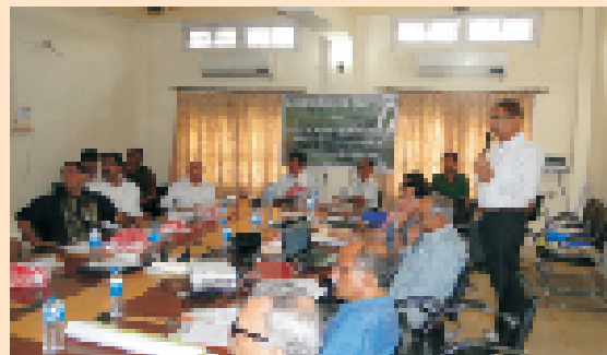
एक सींग गैंडा हेतु समन्वय बैठक