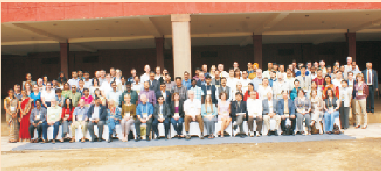
सीबीएसजी वार्षिक बैठक के प्रतिभागी